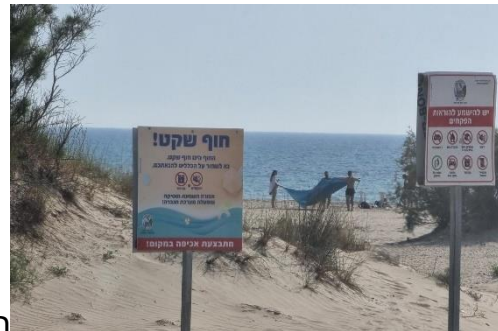
הציבו שילוט ומפורסם באתר המועצה