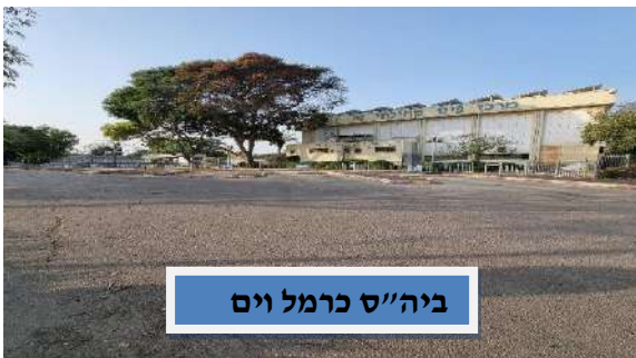
ביה"ס כרמל וים