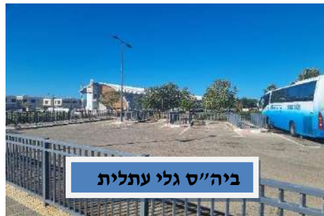
ביה"ס גלי עתלית