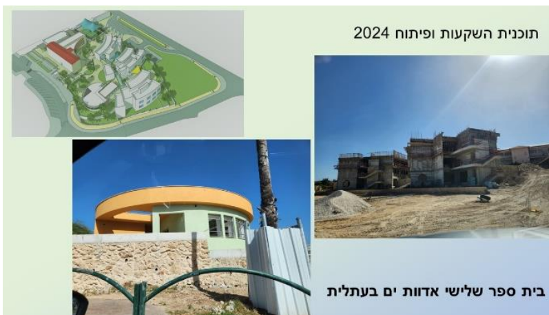
תוכנית השקעות ופיתוח 2024